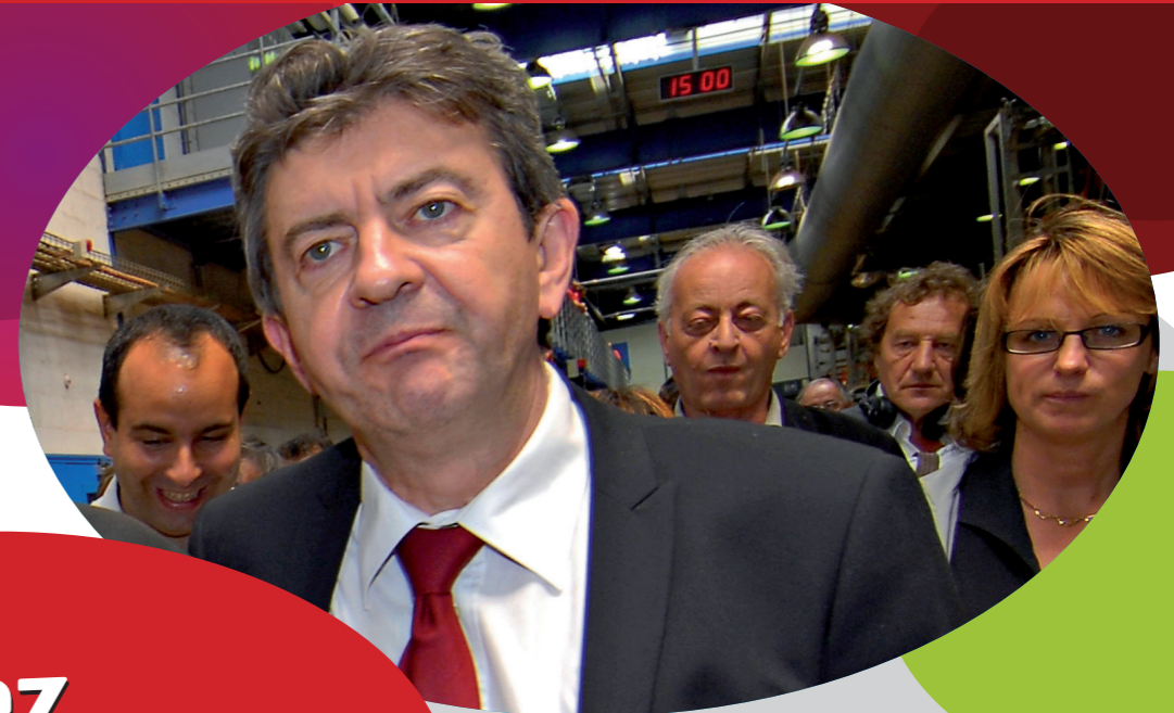
Visite de soutien aux salariés en lutte de l'usine FRALIB

Nous sommes des femmes et des hommes de gauche issus de courants divers, syndicalistes, associatifs, citoyens adhérents ou non à des organisations politiques.